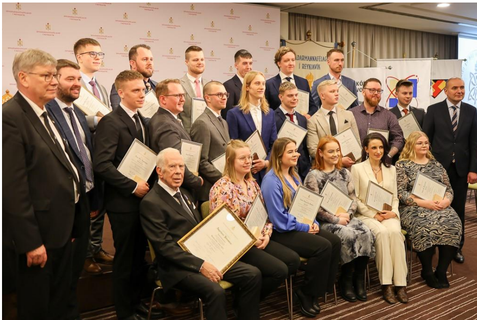
Verðlaunahafar á Nýsveinahátíðinni 2024